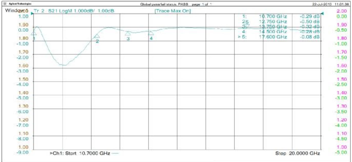
Потери 2 КВП друг на друга